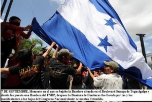
7 DE SEPTIEMBRE, Momento en el que se baja la Bandera situada en el Boulevard Suyapa de Tegucigalpa y donde fue puesta una Bandera del FNRP, después la Bandera de Honduras fue llevada por las y los manifestantes a los bajos del Congreso Nacional donde se nuestro Extensión.