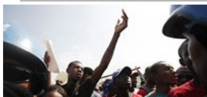
Situación de emergencia en Haití