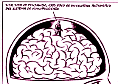
Sospecha: herramienta control