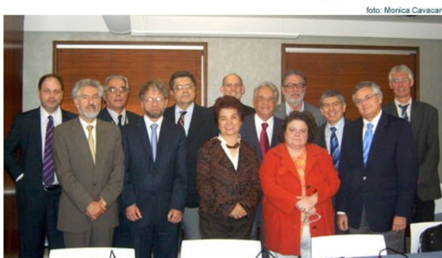
La Comisión, reunida en su segunda reunión, en Bogota

Los días 4 y 5 de septiembre tuvo lugar en Bogotá, Colombia, el Segundo Encuentro de la Comisión Latinoamericana sobre Drogas y Democracia con la presencia de los ex presidentes César Gaviria (Colombia), Fernando Henrique Cardoso (Brasil) y del ex vicepresidente de Nicaragua, Sergio Ramírez. Junto con otros miembros que integran la Comisión y con especialistas en el tema, los dignatarios analizaron y debatieron los aspectos fundamentales de las políticas adoptadas en el combate al consumo y tráfico de drogas en América Latina.