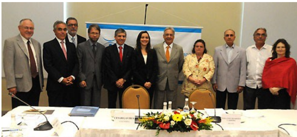
Integrantes de la Comisión Latinoamericana de Drogas y Democracia reunidos en Rio de Janeiro